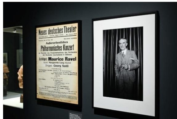
Exhibition view