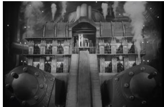
Still shot from Metropolis (1928)