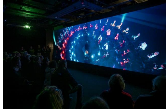
Exhibition view

Du jazz et du métal à la danse contemporaine et au cinéma, le Boléro n'a cessé d'être réinterprété, témoignant de son influence durable . Des chorégraphes comme Maurice Béjart en ont révolutionné la mise en scène. Au cinéma, des réalisateurs tels qu'Akira Kurosawa l'ont utilisé avec un effet saisissant. Cette présence intemporelle est au cœur de l'exposition, qui met en lumière le Boléro à travers une riche installation audiovisuelle, illustrant sa perpétuelle réinvention dans les différentes disciplines artistiques.